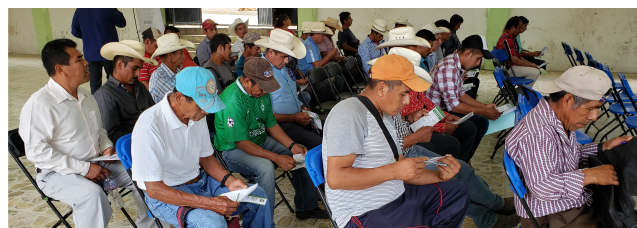
Fotografía: únicamente ilustrativa

El CCS debe de una inspección final a la obra una vez terminada esta, así como registrar los trabajos realizados en el formato de cédula de control y vigilancia de obra para comités de contraloría social. Etapa 3 Resultados (Anexo 13).