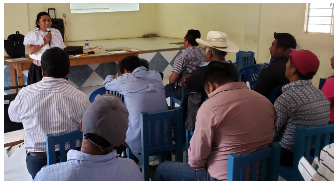
Fotografía: únicamente ilustrativa

Estará integrado por cinco habitantes , quienes desarrollarán sus funciones a través de una presidencia, una secretaria y tres vocalías, y se elegirán de entre la ciudadanía directamente beneficiada con la obra, mediante una Asamblea General que se celebrará, por lo menos, cinco días antes de la fecha de inicio de la obra. Sin excepciones, el Ayuntamiento entregará la información a la que está obligado en materia de transparencia y acceso a la información pública de la misma, para que el Comité realice sus trabajos oportunamente.