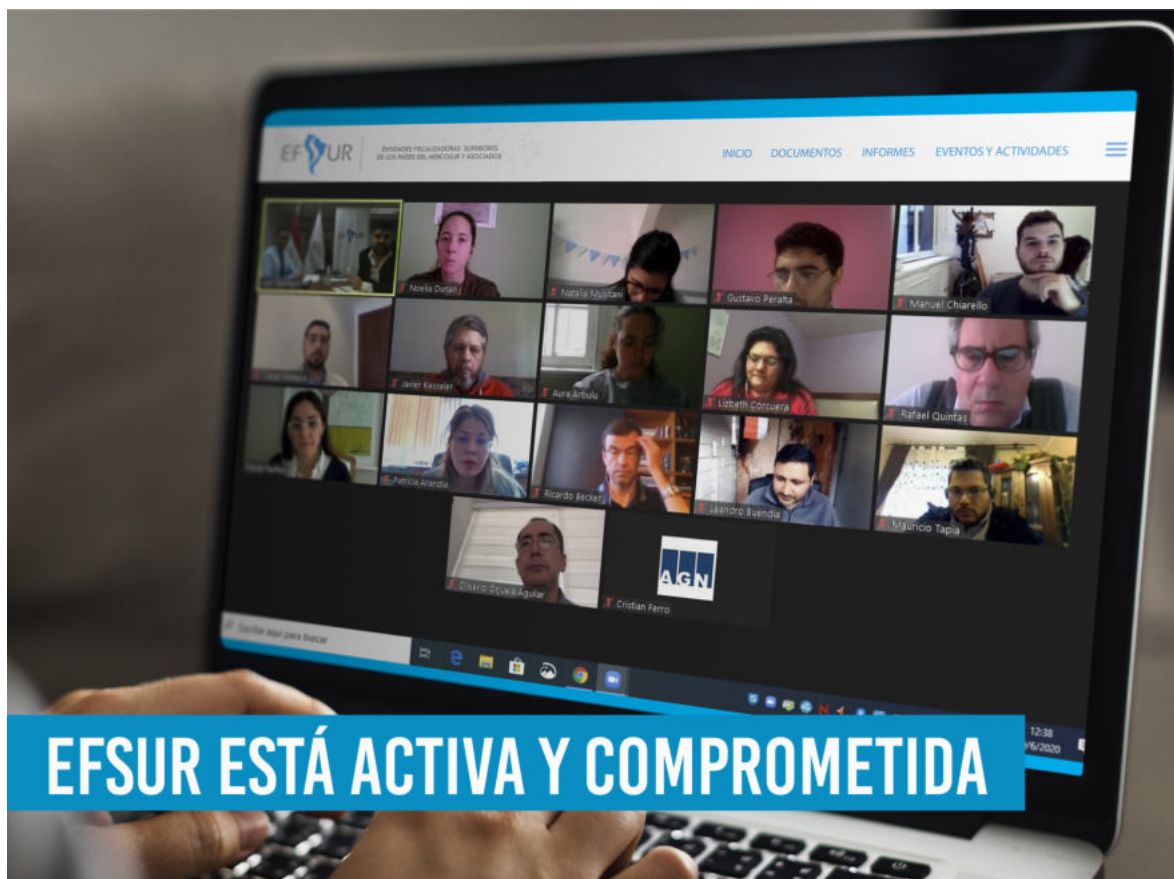
Reunión de trabajo EFSUR sobre Auditoría Coordinada.

En la última reunión de trabajo participaron todos los equipos que están llevando adelante la auditoría coordinada en la cual se evalúa el cumplimiento del ODS 1: Poner fin a la pobreza considerando la visión de género de manera transversal, teniendo en cuenta la interdependencia de los ODS. En dicha reunión se estableció la revisión del Índice de eficacia integrado y de los plazos establecidos previos a la pandemia.