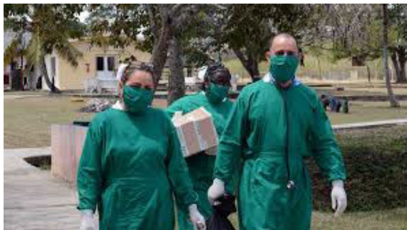
Acciones de control en centros de aislamiento.

La Contraloría General por su parte, se incorporó activamente a estos planes mediante acciones de control en centros de aislamiento o de cuarentena y en lo interno aplicó un conjunto de medidas para prevenir cualquier contagio entre sus trabajadores. Igualmente, estableció un programa virtual de capacitación de las nuevas Normas Cubanas de Auditoría y su Manual de Procedimientos, en el interés de que este tiempo de teletrabajo se dedique especialmente a la autopreparación para elevar el nivel profesional de los auditores, alcanzar una eficiente aplicación de los principios relacionados con los requerimientos organizacionales, disminuir riesgos en la ejecución del proceso y alcanzar resultados superiores en correspondencia con sus objetivos.