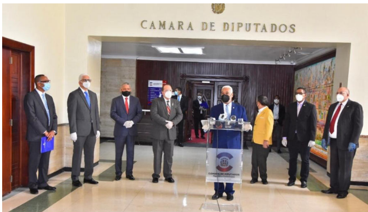
Miembros del Pleno de la CCRD en momento en que es recibido el Informe de Ejecución Presupuestaria 2019 por autoridades de la Cámara de Diputados.

La Cámara de Cuentas de la República Dominicana (CCRD) entregó al Congreso Nacional el Informe sobre el Análisis y la Evaluación de la Ejecución Presupuestaria y la Rendición de Cuentas Generales del Estado, correspondiente al año fiscal 2019, en cumplimiento a lo establecido en la Constitución y la Ley 10-04 y su Reglamento de Aplicación 06-04, que la rige, donde señala que este Informe debe ser entregado cada año a finales del mes de abril.