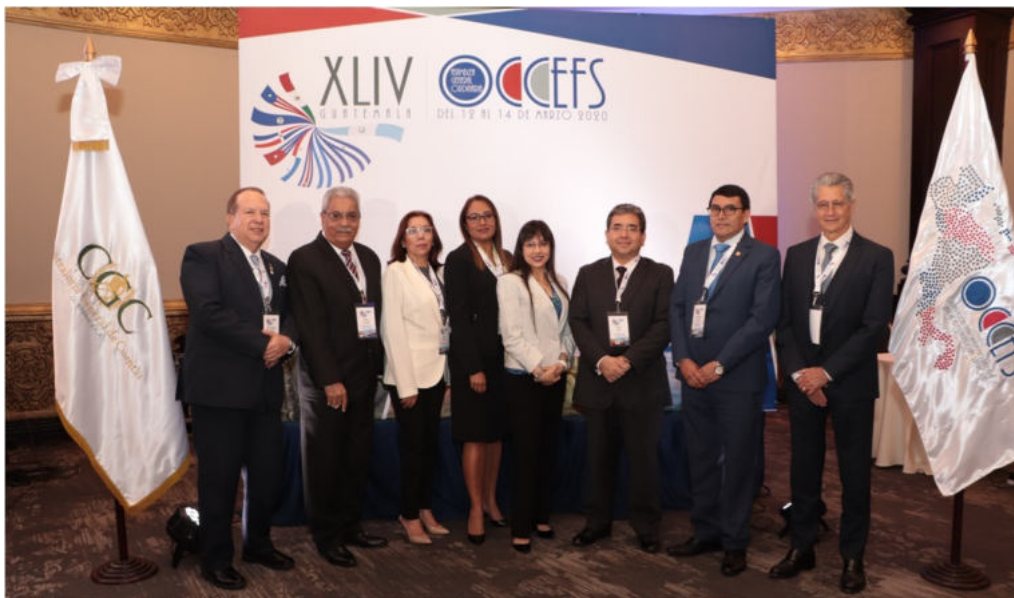
XLIV Asamblea General Ordinaria de la OCCEFS.

Del 11 al 14 de marzo del año en curso, en la ciudad de Guatemala, se llevó a cabo la XLIV Asamblea General Ordinaria de la OCCEFS, con la participación de las Entidades Fiscalizadoras Superiores de Puerto Rico, República Dominicana, Honduras, Panamá, México, Nicaragua y El Salvador, abordando temas de interés para la región.