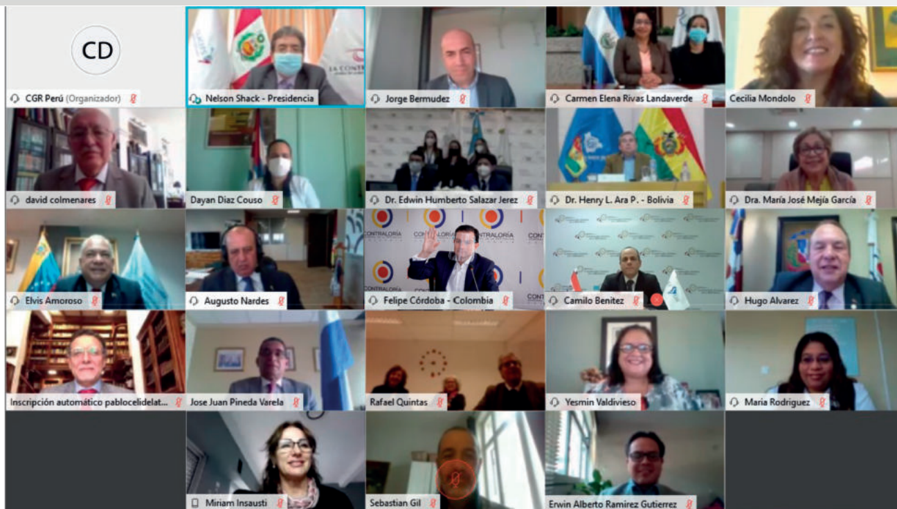
Fotografía oficial de la LXXI Reunión Ordinaria del Consejo Directivo de la OLACEFS realizada por primera vez de manera virtual.