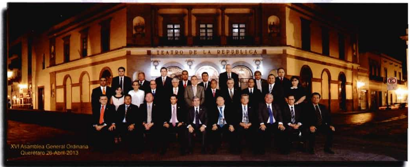
Asamblea General Ordinaria de ASOFIS