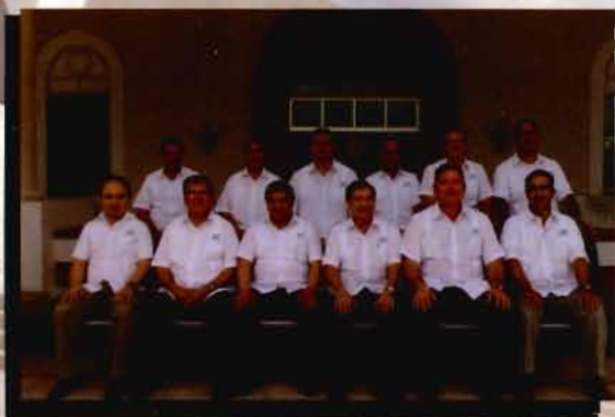
LXXXIII Reunión del Consejo Directivo y XVI Asamblea General Ordinaria de ASOFIS