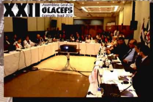
LIII Reunión de Consejo Directivo y XXII Asamblea General de la OLACEFS