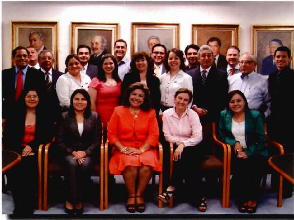
Colaboración: Órgano Superior de Fiscalización del Estado de México