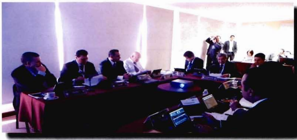
Consejo Directivo de ASOFIS